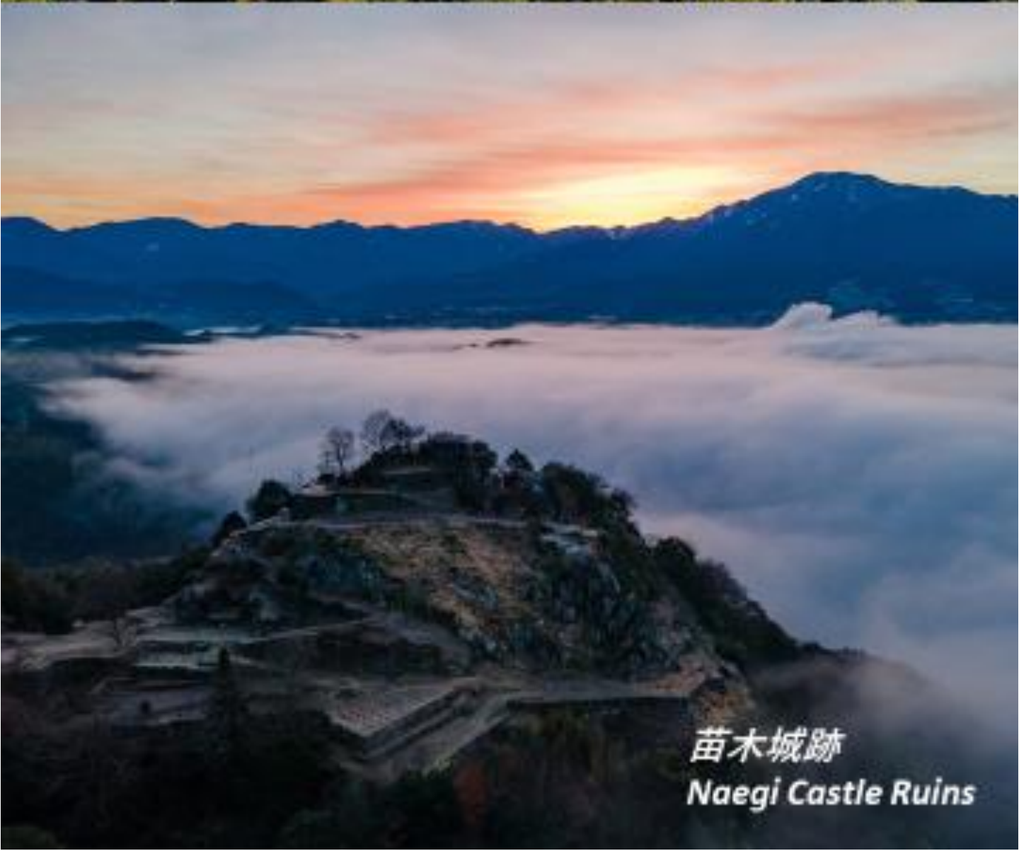
苗木城跡 Naegi Castle Ruins