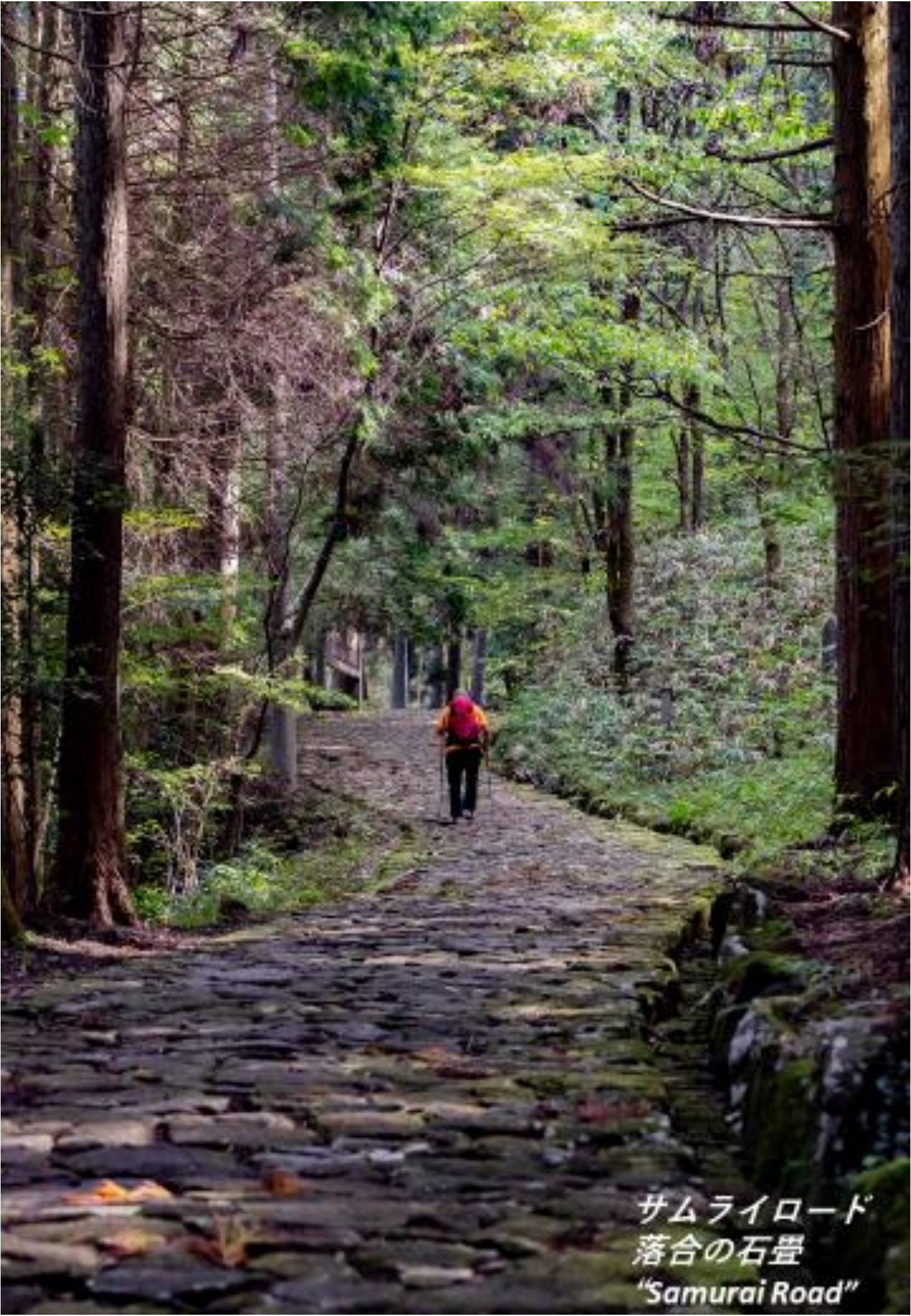
サムライロード 落合の石畳 "Samurai Road"