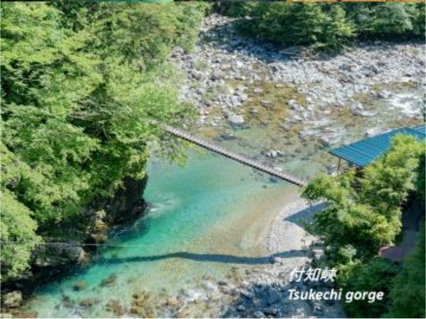
付知峽 Tsukechi gorge